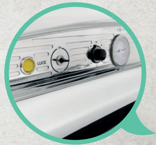
FRONTALINO INOX MORE TO LIKE ON THE INSIDE STAINLESS STEEL CONTROL PANEL