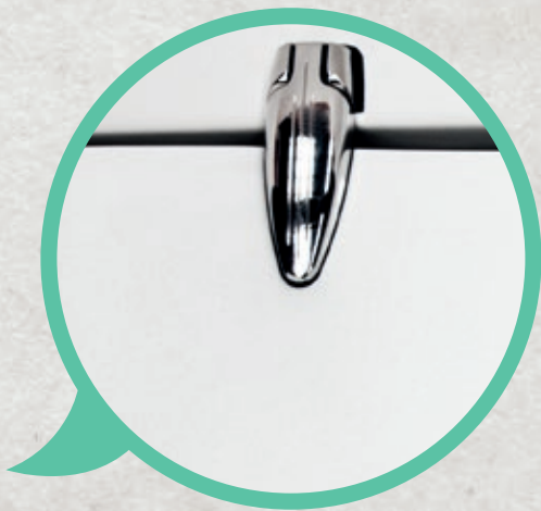
CERNIERE DEL COFANO IN STILE VINTAGE COOLNESS TO TOUCH BONNET HINGES WITH VINTAGE STYLING