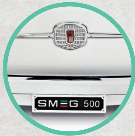
TARGA SMEG500 A SIGNED CULT THE NUMBER PLATE OF THE SMEG500