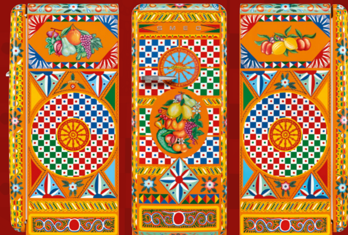
Frigorifero monoporta / Single door refrigerator, 60 cm