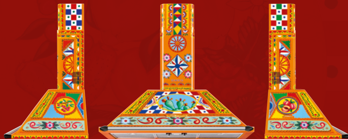
Cappa a parete / Chimney hood, 90 cm