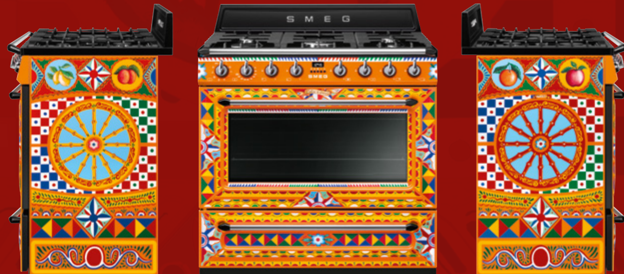
Cucina da arredamento / Freestanding cooker, 90 cm