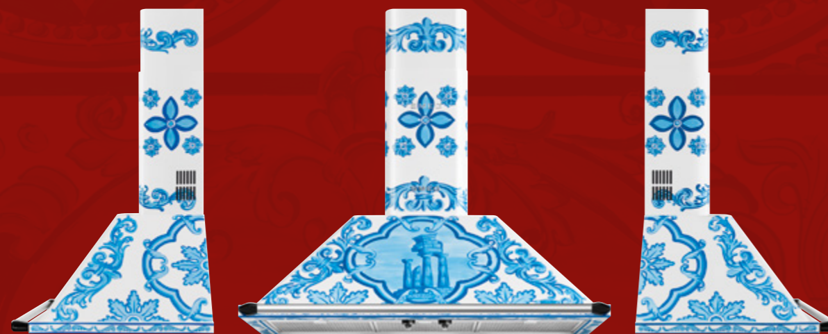
Cappa a parete / Chimney hood, 90 cm