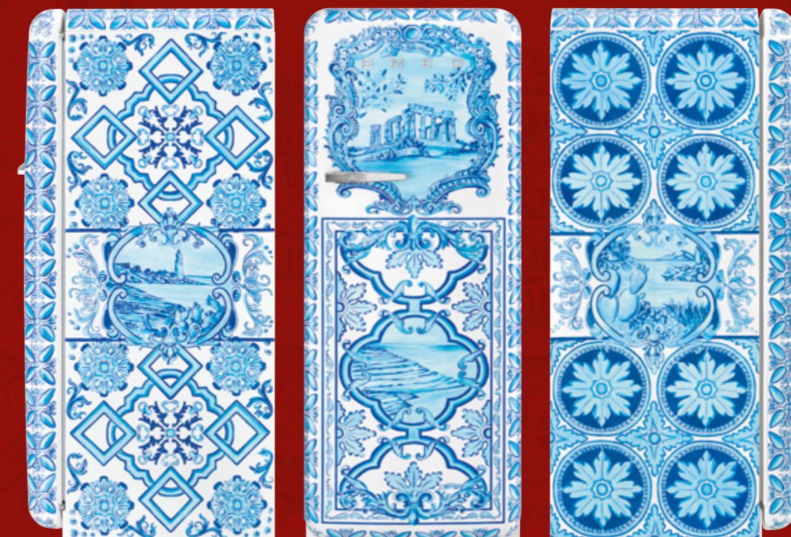
Frigorifero monoporta / Single door refrigerator, 60 cm