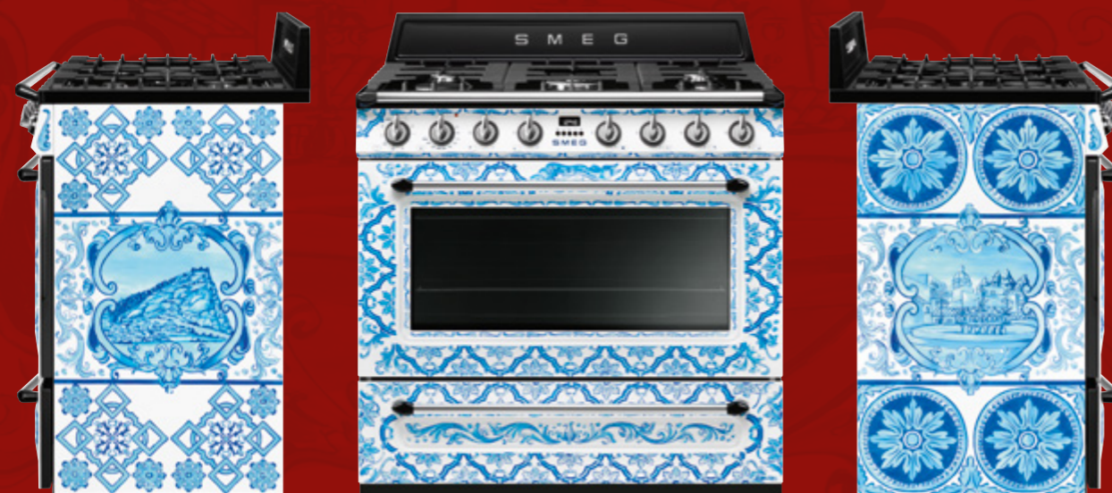
Cucina da arredamento / Freestanding cooker, 90 cm